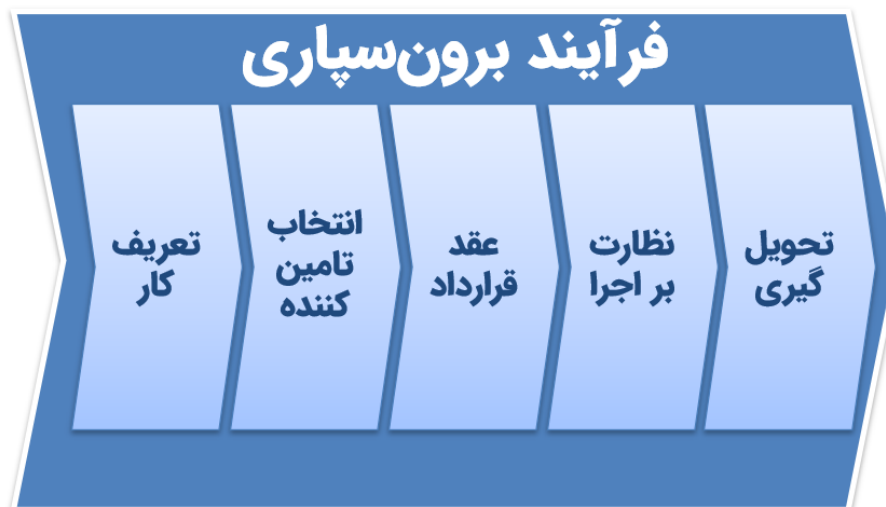
شکل ۲) مراحل کلی فرآیند برون سپاری