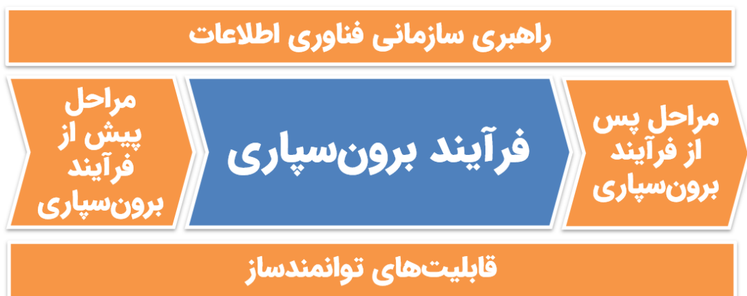
شکل ۱) زمینه سازمانی فرآیند برون سپاری